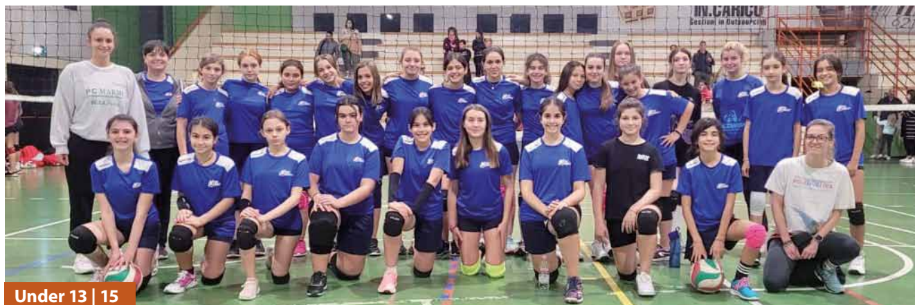
Under 13 | 15